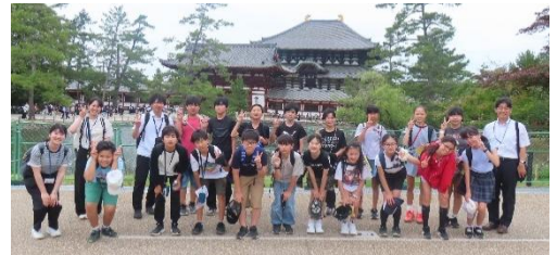
6/17 修学旅行 東大寺

1学期も残すところあと1ヶ月となり、まとめの時期を迎えました。教職員一同、最後まで気を緩めることなく、日々の教育活動に全力を尽くしてまいります。