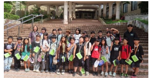
5/26 野外教育活動 美浜自然の家

さて、私は毎日、子どもたちが登校する際、昇降口であいさつをしながら出迎えています。いつも元気に「おはようございます！」と声をかけてくれる子が多く、私自身、毎日たくさんの元気をもらっています。低学年の児童とはじゃんけんをすることもあります。ある日、一人の子が「校長先生、じゃんけんで勝ったら、来年も〇〇先生を担任にしてください！」と、目を輝かせながら挑んできました。また別の子は、通学路で摘んだ小さな花を大切に持っています。「その花、どうするの？」と聞くと、「〇〇先生にあげるの！」とうれしそうに教えてくれました。こうした姿を見るたびに、「この子たちは、担任の先生のことが大好きなんだな」と、校長としてとても嬉しく、微笑ましく感じています。