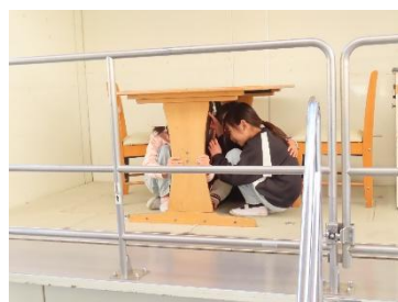
机の下にもぐる3年生

奥田小学校では、12月11日に3年生と6年生が、町の防災課にご協力いただき、起震車「なまず号」による地震体験を実施しました。震度6相当の強い揺れを体験した児童たちは、激しい揺れが始まると同時に悲鳴を上げながら、急いで机の下にもぐり、机の脚を必死にしがみついた姿が見られました。この身をもった体験は、地震の怖さを深く心に刻みつけたことでしょう。起震車の中には最低限の備品しかありませんが、実際の家庭にはテレビや本棚、タンスなどの家具・家電が置かれています。もし固定などの対策がされていなければ、揺れによってこれらが倒れたり飛んできたりし、命に関わる事態になる可能性があります。この体験を機に、多くの児童が「家具の固定」や「非常持ち出し品の確認」といった具体的な備えの重要性に気づくことができたはずですよ。