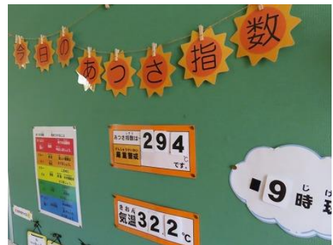
保健コーナーの暑さ指数表