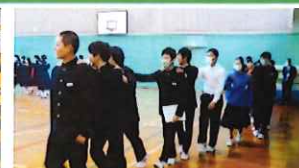
生徒会 思い出つくりキャンペーン