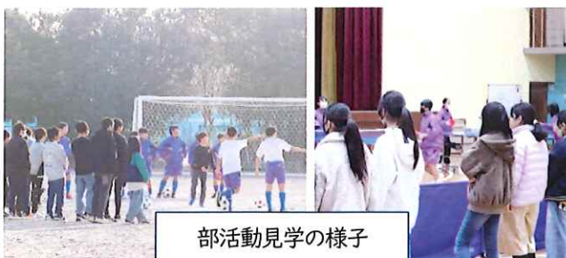
部活動見学の様子

1月23日(木)、令和7年度入学説明会を行いました。学習や生活についての説明に続き、部活動見学がありました。春のような暖かな日差しの下、生き生きと部活動に取り組む在校生と、期待に満ちた様子で見学する新1年生の表情が輝いていました。4月のご入学を心待ちにしています。