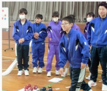
ボッチャ体験（1年生）

【2年生】上級学校訪問・名古屋班別研修へ出かけました。班の仲間と協力し、充実した1日を過ごしました。今後の進路選択へ向け、意識を高める機会となりました。