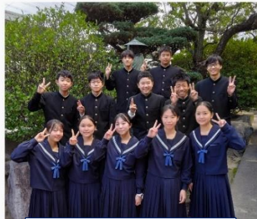
上級学校訪問（2年生）

【1年生】日本福祉大学の先生と学生の皆さんに教わりながら、パラスポーツ「ボッチャ」を体験しました。とても楽しく盛り上がりました。