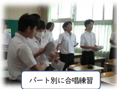
パート別に合唱練習