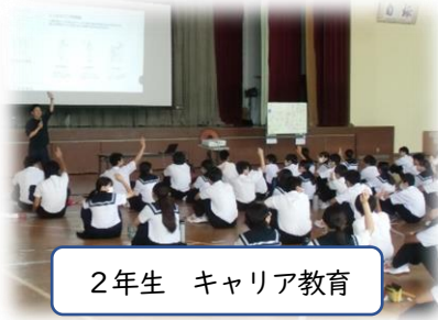
2年生 キャリア教育