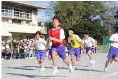
体育の部 (全員リレー)