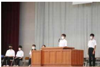
立会演説会の様子