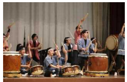
日福高校「楽鼓」の演奏

20日(木)の文化の部では、午前中に合唱コンクールが行われました。練習では協力が足らなかつたり意見がぶつかり合ったりする中で、パートや全体での練習を重ね、絆を深め、各学級が美しい歌声を響かせることができました。その後、日本福祉大学附属高校の和太鼓「楽鼓」の演奏を聴きました。午後は、総合閉会式を行い、その後片付けをしました。今年も、コロナの影響で制約を受けながらでしたが、生徒達は準備から練習に真剣に取り組み、素晴らしい姿を見せてくれました。多くの場面で生徒の成