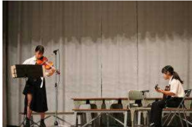
有志発表 (バイオリンとギター演奏)