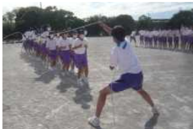
体育の部 (大縄跳び)