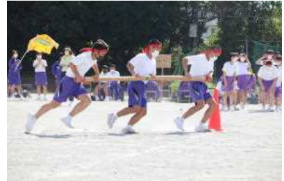
体育の部 (台風の目)