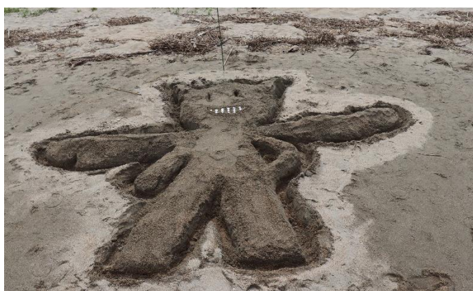
悪魔の完成！迫力ある！！