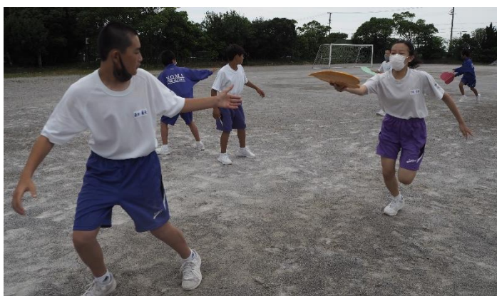
思いやりが込められたバトンを丁寧にパス