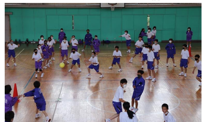
思いやりをもって投げています