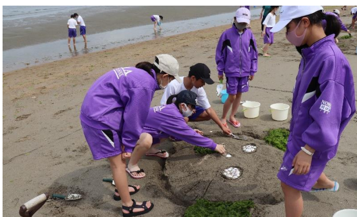
海藻や貝、石を使って製作中