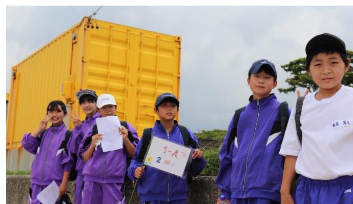
ザ・グッドサン・ビーチハウス前にて