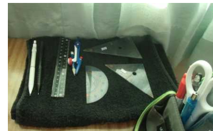
文房具を大切にしている様子