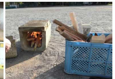
パプリック焼き芋交流会は成功！