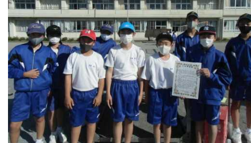
A組：ソフトボール三山杯優勝チーム