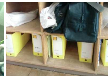
いつも綺麗なロッカー