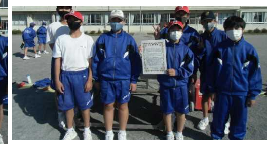
B組：ソフトボール三山杯優勝チーム