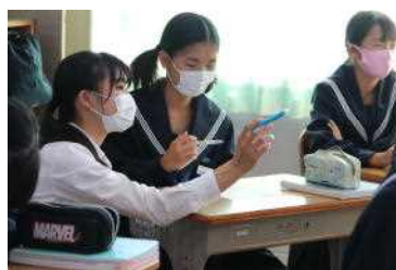
生徒にアドバイス

愛知教育大学の2年生で本校卒業生の2名が学校体験活動に来ました。将来、学校の先生や学校に関わる仕事に就くつもりの学生が、学校ではどんなことを行っているのかを知るためのものです。1日ごと別のクラスにつき、時には先生の手伝いをしてもらったり、事務の仕事を教えたりしました。