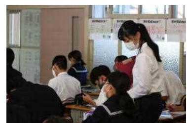
生徒を見守っています