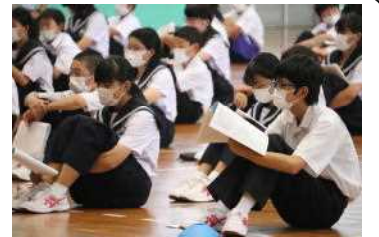
真剣に提案を聞く生徒