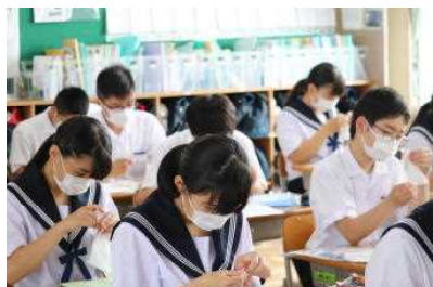
立体マスク作り（2年家庭）