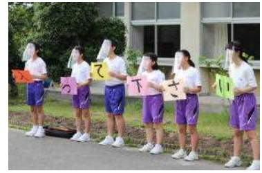
勧誘ライブ（合唱部）