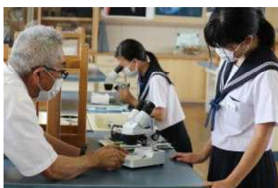
顕微鏡で観察（1年理科）