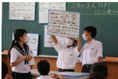
ホワイトボードで発表（1年社会）