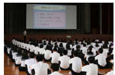
全体生徒指導で話を聞く生徒

その後、通学国会を行いました。通学路の危険箇所や名簿の確認をしたり、団長や副団長を決めたりしました。1年生は、自分の通学路を地図に記入しました。