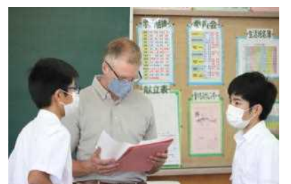
A L Tと授業（3年英語）