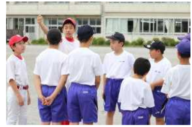
先輩の話を聞いている（野球部）