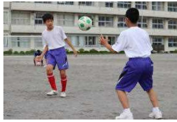
先輩と練習（サッカー部）

学校が再開し、1年生は部活動を決めることになります。6/9に部活動見学、6/11～19に体験入部、6/23～26に仮入部、7/7に本入部となります。見学・体験入部前には1年の廊下に各部活動の勧誘用ポスターが貼られていて、1年生は熱心に見ていました。体験入部では、各部活動の練習を少しさせてもらったり、体力作りをしたりしていました。また、合唱部は1年生の下校時に勧誘のためにフェイスシールドを付けてライブを行っていました。2・3年生は1年生が部活動に入ってくるのを楽しみにしています。