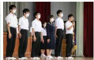
抱負を述べる生徒会長