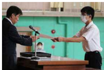
任命状を受け取る生徒

朝会で、前期生徒会役員と学級三役の任命を行いました。生徒会役員は1人ずつ全校生徒の前で抱負を述べました。その後、後期役員が校旗を受け渡し、引継ぎをしました。役員と学級三役が力を合わせ、他の生徒と協力して素晴らしい学校にしていきます。