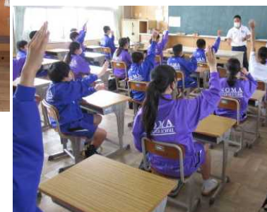
積極的な挙手に感激!