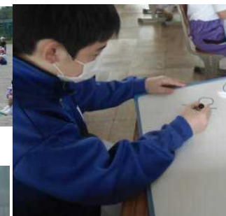
自分の考えを表現