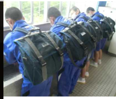
手洗い・うがいをして