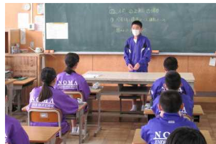
クラス全員の前で自己紹介