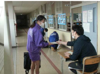
体温チェック表を出す