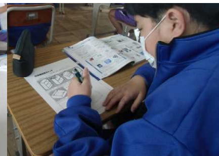
技術の授業では、作図に挑戦