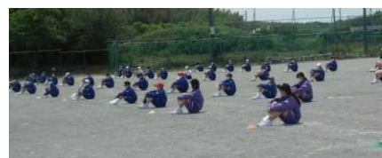
体育の授業では等間隔で活動