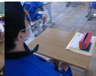
放課中に次時の授業準備!