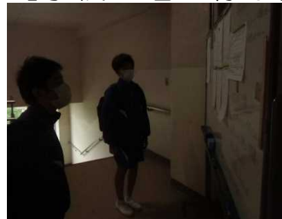
登校し、ホワイトボードをチェック