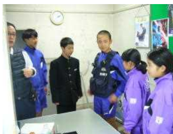
交番で警察の装備を装着

1年生がDT(総合的な学習)の一環で職場訪問を行い、美浜町内の事業所を見学しました。実際に働く人の話を聞き、疑問に感じたことをインタビューして教えてもらうことで、仕事の大変さややりがいを感じるとともに、自分の将来について考える機会となりました。