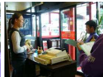
中華料理店でインタビュー