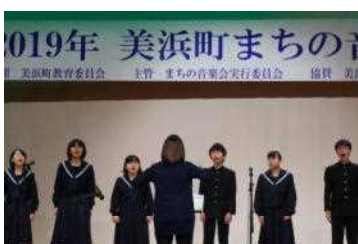
歌を披露する合唱部

「美浜町まちの音楽会」に、合唱部の生徒が参加して、来場者に美しい歌声を届けました。また、運営も手伝い、会を盛り上げました。