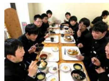
大学の学食で昼食を食べる生徒