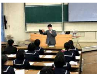
大学職員の方から話を聞く生徒

2年生が上級学校訪問を行いました。班別で、知多半島内の公立高校を訪れ、実際に授業を見学したり、高校の先生の話の聞いたりしました。午後は、日本福祉大学の東海・美浜キャンパスの見学をしました。自分たちの進路実現に向けて、たくさんのお話を学ぶことができました。