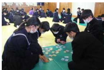
クラス対抗で百人一首大会

6時間目に1年生が、武道場で百人一首大会を行いました。大会前には、教室で百人一首を覚えている風景がよく見られました。大会では、1年生の先生が読み上げると上の句だけで札を取る様子も見られました。ここから古典に親しむことができるといいです。