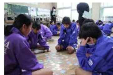
百人一首大会の練習