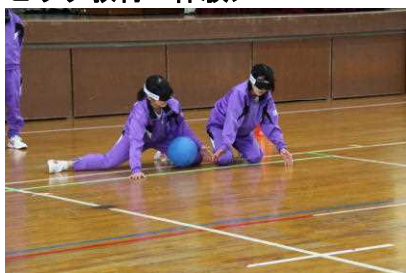
ゴールボールの体験

町内の中学校1年生と小学校4年生を対象にパラリンピック教育を行っています。1週間前に担任がパラリンピックについての講義を行い、次の週には、日本福祉大学の先生と学生が実技を教えに来てくれてパラリンピックスポーツの体験をしました