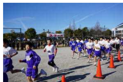
中学生男子の部の様子

風もなくおだやかな天候の中、美浜タウンマラソンが行われました。今年も部活動ごとに、多くの生徒が参加しました。自分の力の限り一生懸命に走る姿は、清々しく気持ちのよいものでした。