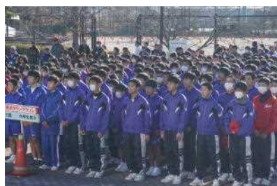
開会式で整列している生徒