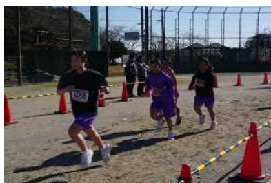
中学生女子の部の様子