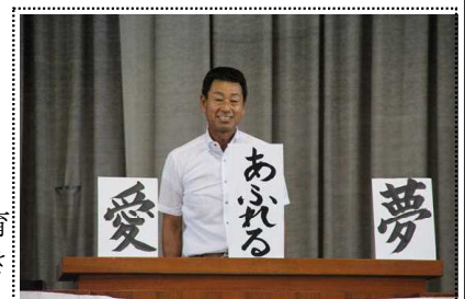
「愛と夢のあふれる学校」を創ろう