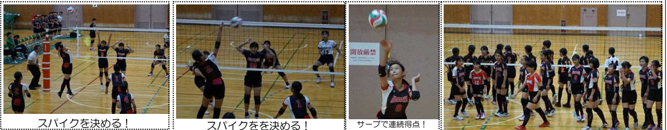
スパイクを決める！

9月14日（土）、1回戦は大府北中と対戦しました。サーブが入らず苦戦しましたが、1セット目を25×18、2セット目を25×19で取り、勝ちました。2回戦は、1回戦シードの知多中と対戦しました。知多中は1年生中心のチームでしたが、小学生からやっている選手が多く、強いチームでした。1セット目7×25、2セット目10×25で取られ、敗れました。