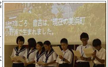
交流は音吉から始まった

4泊6日の研修を通して、ニーアン中学校とホームステイの生徒及び家族の皆さんに、たいへんお世話になりました。もともと多民族国家なので、言葉が通じない相手をもてなす術を心得ているように感じました。ここは、私たち日本人が見習いたいところです。まずは、11月にニーアン中の先生と生徒が来たときに温かく迎えたいと思います。そして、来年にせまったオリンピック・パラリンピックのホストタウンとしての役割を積極的に果たすことが、世界に羽ばたく日本人の育成につながると思います。