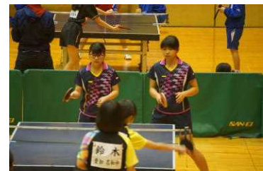
東海ジュニア 卓球女子