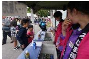
飲み物の販売の手伝い