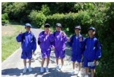
自然の家をめざして

1日目は、学校から自然の家までウォークラリーをしました。天気の良い中、班の友達と協力して課題をこなしながら歩きました。入所式の後、体育館で学年レクリエーション、貨物列車・猛獣狩り・クラス対抗ドッジビーをして盛り上がりました。それから、心を静めて座禅体験をしました。その後夕食を食べ、入浴した後に、決意表明をしました。体育館で、一人一人が今後の目標を発表しました。学級全員が発表した後に校歌を歌いました。どの学級もそれぞれの決意が表された歌声となっていました。2日目は、朝のつどいの後、朝食をとり、清掃をしました。ベッドの下までもぐり込んできれいにする姿が見られました。その後は、研修室で防災体験のHUG（避難所運営ゲーム）をしました。少し1年生には難しい部分もありましたが、もし災害が起きたら役に立つ体験をすることができました。大きなけがや病気もなく、無事に合宿を終えました。合宿中は、友達との生活を楽しみ、笑顔がいっぱいの2日間でした。また、時間や生活でのルールを守ること、クラスや班の友達と協力することなど、集団での行動に欠かせない大切なことを学びました。そして、友達と多くの時間を過ごすことで、絆も深まりました。スローガンである「もっていくのはがんばる力 持ち帰るのは最高の思い出」も達成できました。