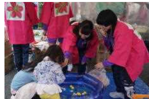
小さな子にも優しく対応

出店の手伝いをしました。生徒はみんな準備から一生懸命に活動しました。店に来てくれた人達に丁寧に対応していました。