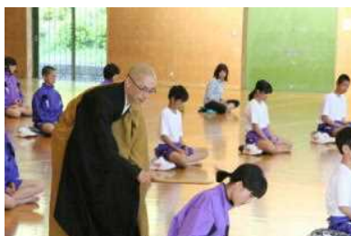
心静かに座禅体験