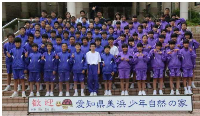
1年生全員で「はいポーズ！」