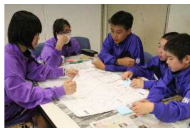
HUG「避難所運営は難しい」