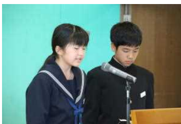
司会を務める選挙管理委員

どの立候補者も、自分が力を入れたいことを公約に掲げ、立派に演説をすることができました。前期生徒会役員の活躍を期待しています。