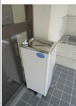
購入したウォータークーラー

前号で紹介させていただいた厄歳の皆様からのご寄付で、ウォータークーラーを2台購入させていただきました。特に夏場には猛暑が続き、学校生活においても熱中症対策が不可欠です。大切に使用させていただきます。