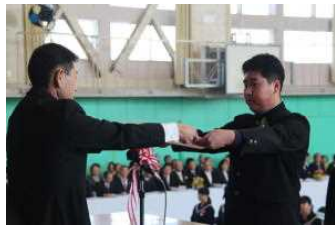
卒業証書授与の様子

卒業生は、担任の最後の呼名で、大きな返事をし、卒業証書を受け取りました。別れの歌では、生徒一人一人の別れを惜しむ気持ちが歌声を自然に大きくさせ、そのハーモニーが体育館中に響き渡りました。