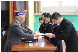
表彰を受ける生徒

同窓会入会式と皆勤・精勤賞の表彰式がありライオンクラブより、9年間皆勤2名、精勤4名と、3年間皆勤12名が表彰されました。