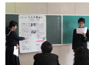
1年職場訪問の発表の様子