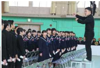
上げば尊し すばらしい歌声