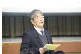
2年進路説明会の様子

1年生はDT発表会をしました。職場訪問について、班ごとに発表しました。2年生は進路説明会を開催しました。進路選択に向けて、進路指導主事が説明しました。