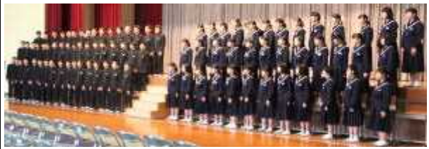
全員で「YELL」を歌う3年生

1年生は歌と呼びかけで、2年生は部活動ごとの言葉で感謝の気持ちを伝えました。その気持ちに応えるように、3年生は「YELL」を歌いました。3年生によるコントも行われ、全校生徒が温かい雰囲気の中かで、楽しいひとときを過ごしました。