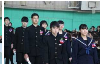
卒業生退場 お別れのとき…