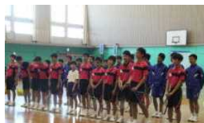
ソフトテニス部の紹介