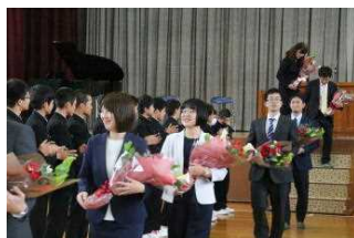
離任式（見送りの様子）