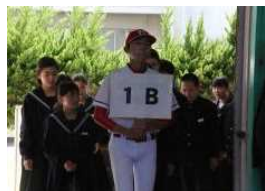
新入生歓迎会（入場）