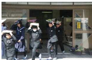
避難訓練（避難の様子）