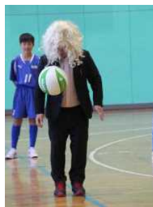
サッカー部の紹介