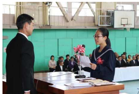
入学式（新入生誓いの言葉）