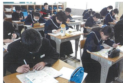
朝のSTの前にテスト勉強