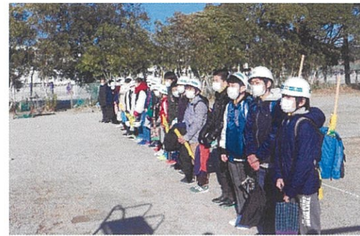
昨年度の入学説明会(部活動見学)