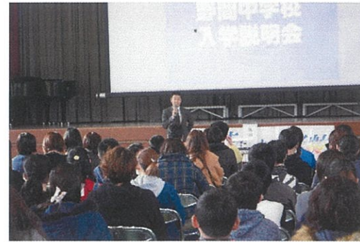
入学説明会で話をする校長先生