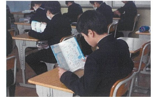
テキストを使つての進路学習