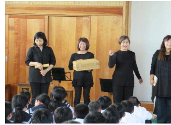
海の子文庫さんの講演の様子

「海の子文庫」の皆さんにブックパフォーマンスをしていただきました。生徒の感想からは、「音や光を使い、見ていて楽しかった」「会話にも気持ちがこもっていて、すごいと思った」など、絵本や物語の楽しさに触れることができた様子が感じられました。