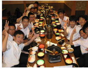
ちゃんこ鍋に舌鼓