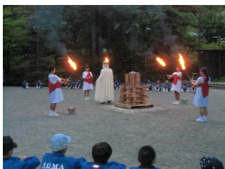
火の神登場でキャンプファイヤー開始