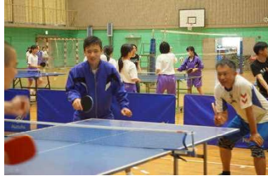
親子でゲームを楽しむ様子

各地域のごみゼロ運動のあと、多くの保護者の皆様に、授業参観にお越しいただきました。ふれあいタイムでは、どの部においても、保護者の皆様と生徒が笑顔で活動し、大変貴重なふれあいの場となりました。