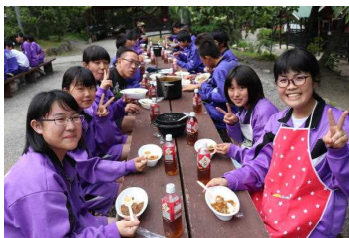
みんなで作ったカレーは最高!

1日目：岐阜アクアトト、キャンプファイヤー 2日目：一日体験プログラム、郡上踊り 3日目：半日体験プログラム