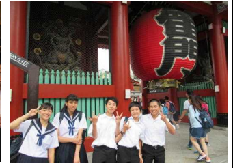
浅草雷門で、ハイ、チーズ!

初日、まずは国会議事堂を見学し、議員食堂で昼食をとりました。午後からはお楽しみのディズニーシー。生徒はみんな大はしゃぎで楽しいひとときを満喫しました。2日目は班別研修を行いました。警視庁や新聞社、大学、博物館など、事前に班で計画した場所を訪れました。夜は、ちゃんこ鍋をおいしくいただきました。3日目は学級別研修でA組は浅草→スカイツリー→国立科学博物館、B組は浅草→クルージング→日本科学未来館、C組は湯島天神→東京大学→浅草を見学しました。3日間を通して、仲間との絆を深めるとともに、大学や企業の見学から自分の将来について考えることができました。