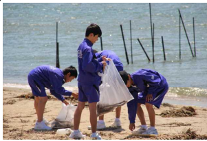
清掃する生徒の様子