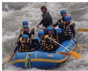
ラフティングはスリル満点!