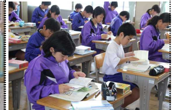
一生懸命辞書を引いています