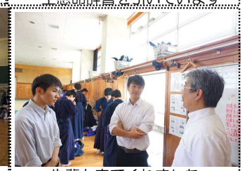
先輩も来てくれました