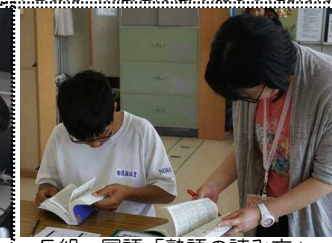
F組 国語「熟語の読み方」