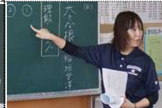
1C 国語「大根は大きな根？」