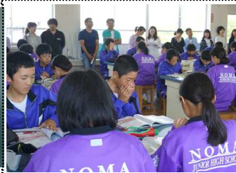
多くの保護者にお越しいただきました