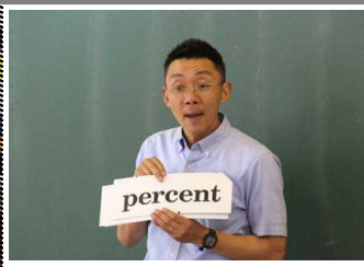
3B 英語「Read and Think」