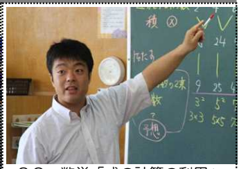
3C 数学「式の計算の利用」