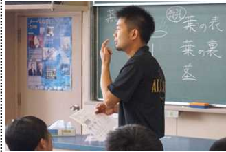
1A 理科「カスパーナーの使い方」