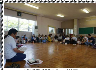
部活動懇談会の様子