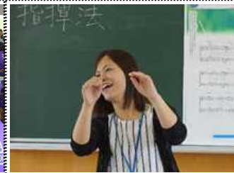
2B 音楽「混声三部合唱を指揮しよう」