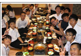
花の舞でちゃんこ鍋を食す