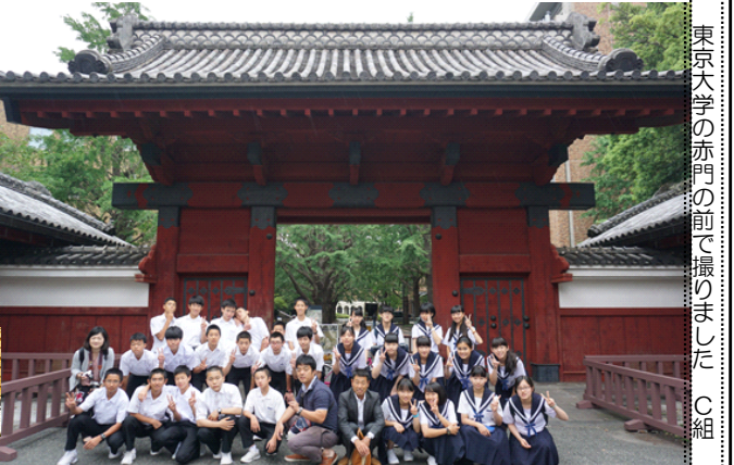
東京大学の赤門の前で撮りました C組