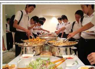
朝食のバイキング

ディズニー・シーで楽しんだ後は、モノレールに乗り、ホテルオークラ東京ベイへ。ホテルオークラは、風呂が大理石で湯船とは別にシャワールームがついていて、朝食のバイキングは品数も豊富でおいしく、大満足した。