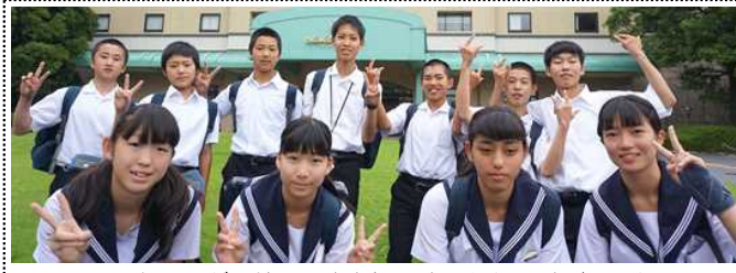
B5とC1が一緒に写真を撮りました(オ-ラをパ-ックに)