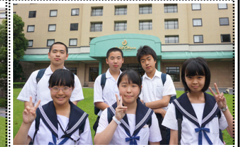
A5 穏やかな雰囲気スタート