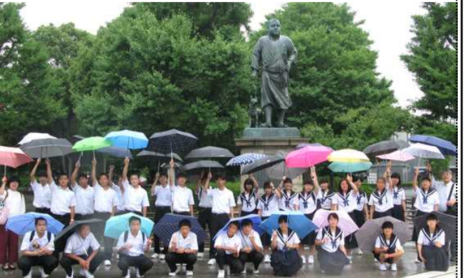
上野公園の西郷さんの銅像の前で撮りました A組