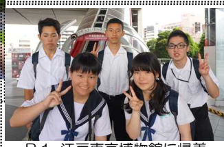
B.1 江戸東京博物館に帰着