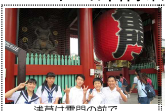
浅草は雷門の前で

B組は、浅草→隅田川の川下り→昼食(お台場 THE OVEN)→日本科学未来館へ行きました。