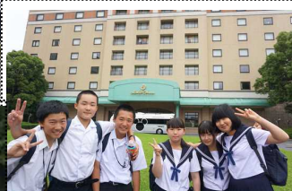
A2 出発の前に(オ-ラをパ-ックに)