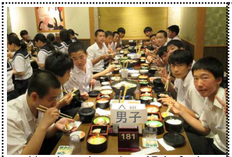
花の舞でちゃんこ鍋を食す

2日目は、電車を取り継いで班別分散研修。1グループ5～7人で15の班に分かれて、東大、日本銀行貨幣博物館、江戸すだれ、向山楽器店、読売新聞社、警視庁、講談社、ソニー、パナソニック、もんじゃ振興会、東京証券取引所、朝日新聞社、サッカーミュージアム、NHK、カップヌードルミュージアム、明治大学などへ研修に出かけました。そして、全班時間に遅れることなく江戸東京博物館に帰って来ることができました。その後、花の舞にてちゃんこ鍋を食べ、両国駅から大江戸線で春日まで行き、春日から徒歩にて東京ドームホテルへ入りました。