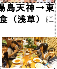
マイアミガーデン