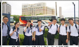
C5 パ-ティ-ステ-ションにて