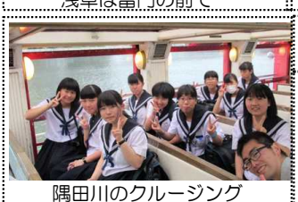
隅田川のクルージング