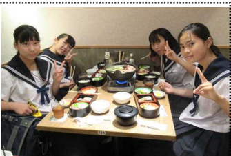
花の舞でちゃんこ鍋を食す