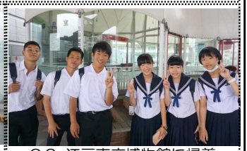
C.2 江戸東京博物館に帰着

2日目は、電車を取り継いで班別分散研修。1グループ5～7人で15の班に分かれて、東大、日本銀行貨幣博物館、江戸すだれ、向山楽器店、読売新聞社、警視庁、講談社、ソニー、パナソニック、もんじゃ振興会、東京証券取引所、朝日新聞社、サッカーミュージアム、NHK、カップヌードルミュージアム、明治大学などへ研修に出かけました。そして、全班時間に遅れることなく江戸東京博物館に帰って来ることができました。その後、花の舞にてちゃんこ鍋を食べ、両国駅から大江戸線で春日まで行き、春日から徒歩にて東京ドームホテルへ入りました。