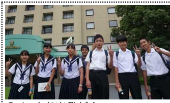
C4 さあ出発だ！(オ-ラをパ-ックに)