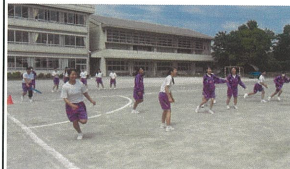
男子顔負けの女子のソフトボール