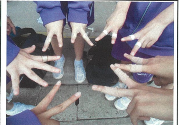
絆創膏の数だけ、本番が楽しみだね