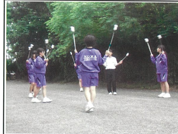
裏の駐車場で、トーチの自主練習

様々な場面で2年生が活躍中！学校の顔となる日もそう遠くはない。2年生の活躍を聞くと、何だかわくわくしてきますね。