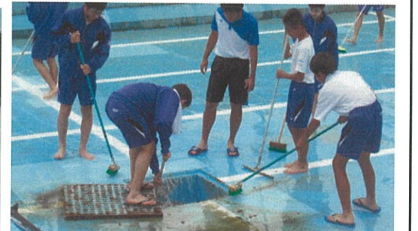
仕上げのプール掃除