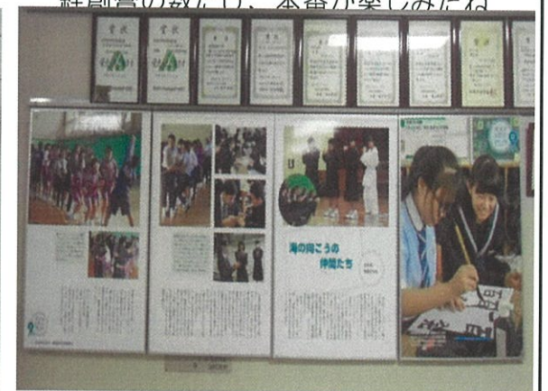
昇降口にニース中との交流風景写真