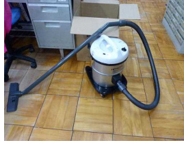
「古稀の会」よりいただいた掃除機

野間・奥田・上野間3地区の厄歳の方々より、プロジェクトをいただきました。行事等で活用したいと思えます。また、「古稀の会」の方々より、業務用掃除機をいただきました。こちらも大切に使用させていただきます。ありがとうございました。