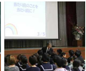
2年進路説明会の様子

1年生はDT発表会をしました。職場訪問について、班ごとに発表しました。2年生は進路説明会を開催しました。進路選択に向けて、進路指導主事が説明しました。