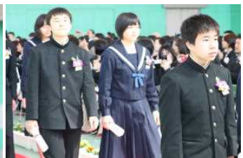
卒業生退場 お別れのときが…