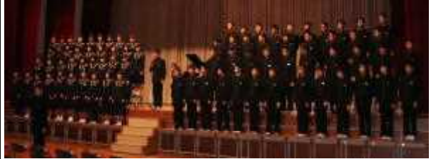
全員で「あなたへ」を歌う3年生

1年生は歌と呼びかけで、2年生は部活動ごとの言葉で感謝の気持ちを伝えました。その気持ちに伝えるように、3年生は「あなたへ」を歌いました。全校生徒が温かい雰囲気の中で、楽しいひとときを過ごしました。