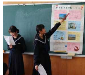
1年職場訪問の発表の様子