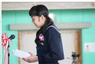
答辞 こみ上げる気持ち…