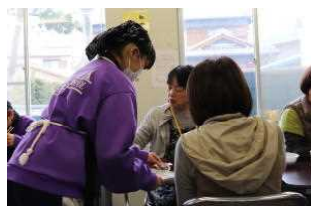
お手伝いをする生徒

前日より、ボランティアの生徒たちが、準備のお手伝いをしました。当日は、本校の合唱部も参加の皆さんと一緒に合唱を披露しました。