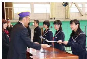
表彰を受ける生徒

同窓会入会式と皆勤・精勤賞の表彰式がありライオンズクラブより、9年間皆勤3名、精勤2名と、3年間皆勤12名が表彰されました。