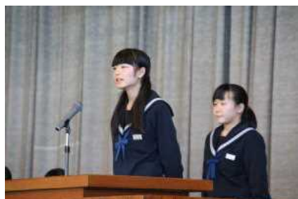
立候補者の演説の様子

立ち会い演説会では、どの立候補者も、任命後に自分が力を入れたことを公約に掲げ、立派に演説をすることができました。当選した前期生徒会役員の活躍を期待しています。