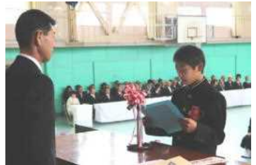
入学式(新入生誓いの言葉)