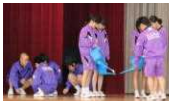
創作園芸部の紹介