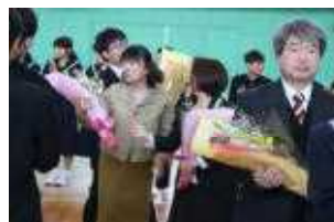
離任式(見送りの様子)