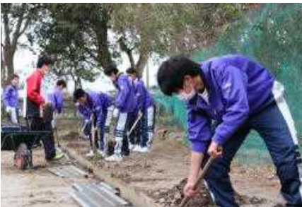
側溝掃除に励む生徒