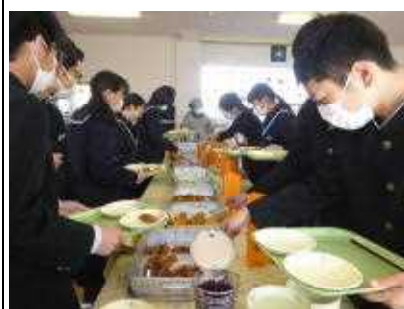
給食を準備する生徒