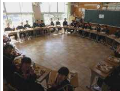
クラスで楽しく会食

鶏肉の磯辺揚げ、ゴボウと赤車エビの甘辛、スパニッシュオムレツ、花野菜サラダ、チーズケーキ、果物などたくさんのおかずやデザートが並び、嬉しそうに配膳していました。教室ではクラス全体で輪を作り、楽しく会食しました。おかわりもたくさんあり、特別な給食にどの生徒も笑顔があふれていました。