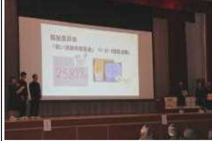
生徒会活動について説明する生徒会執行部

3つの小学校の6年生71名が出席しました。中学校での生活を中心に説明をしました。生徒会執行部は、生徒会活動について分かりやすく説明しました。