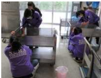
配膳車もきれいになりました

3年生全員が、3年間過ごした中学校をきれいにしました。普段手が届かないところを中心に、トイレ掃除やワックスがけ、側溝掃除など熱心に行いました。とてもきれいになり、気持ちよく学校生活を送っています。お手伝いいただいたPTA委員の皆様、ありがとうございました。