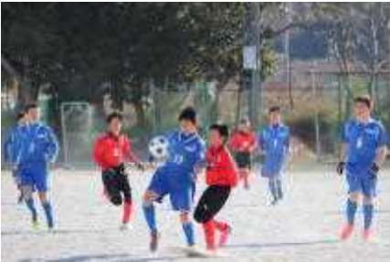
激しく競り合い、ボールをキープ

様々なチームと何試合も熱戦を繰り広げ、個人・チームともに成長が見られました。どの試合にも集中して取り組み、勝利を収めることができました。