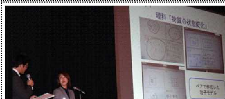
美貴先生のインタビューに答える北川先生