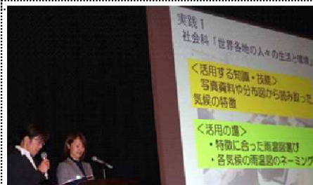
美貴先生のインタビューに答える青木先生