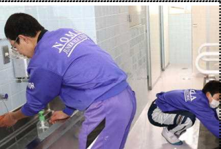
トイレの流しと床掃除