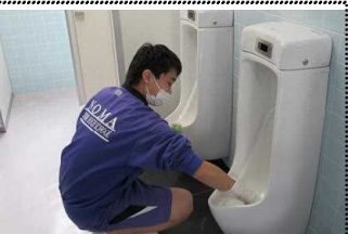
トイレの便器掃除