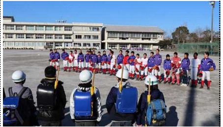
野球部の見学をする6年生