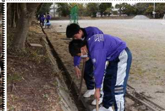
サッカーコート南側の側溝掃除