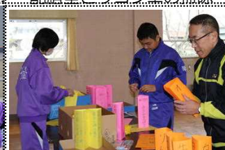
卒業お祝い給食の準備