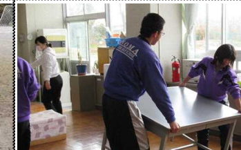
保健室の掃除とワックスかけ