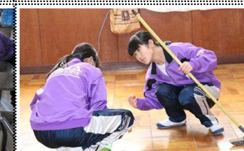
校長室の掃除とワックスかけ