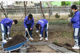
テニスコートの側溝掃除

2月15日（木）、1・2年生が学年末テストで早く帰った日の午後、3年生が愛校作業をしました。3年間過ごしたこの野間中学校を去る前に、心を込めて一生懸命きれいにしてくれました。おかげで野間中学校がたいへんきれいになりました。また、本年度PTA委員の皆さんにもお越しいただき、お子様と同じ場所をお手伝いしてもらいました。ありがとうございました。