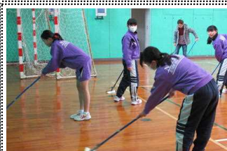
体育館のワックスかけ