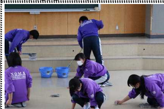
音楽室の床磨きとワックスかけ