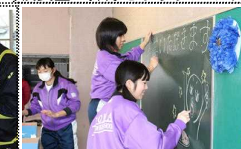
卒業お祝い給食の準備