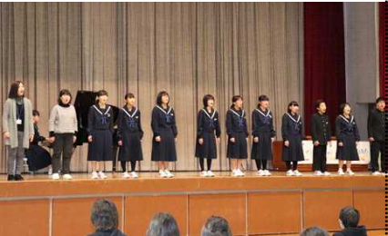
演奏を披露する合唱部

間の流れや生徒会と委員会の活動についてパワーポイントを使って説明をしました。生徒会のみなさん、ありがとうございました。中学校生活の様子が6年生の児童や保護者に伝わったことと思います。後半は、最初に合唱部の演奏を聞いてもらった後、6つのグループに分かれて部活動を見学してもらいました。保護者の皆様には、スマホ教室を受講してもらいました。