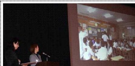
美貴先生のインタビューに答える酒井先生