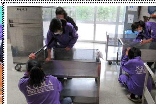
配膳室とワゴン車の掃除