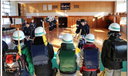
剣道の見学をする6年生