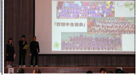
生徒会を中心に委員会が活躍しています

間の流れや生徒会と委員会の活動についてパワーポイントを使って説明をしました。生徒会のみなさん、ありがとうございました。中学校生活の様子が6年生の児童や保護者に伝わったことと思います。後半は、最初に合唱部の演奏を聞いてもらった後、6つのグループに分かれて部活動を見学してもらいました。保護者の皆様には、スマホ教室を受講してもらいました。