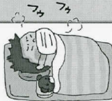
カゼなど欠席者のようす

・今週末、タウンマラソンが予定されていますが、朝の健康観察をご家庭でもしていただき、体調が悪い場合には無理をせず、参加を見合わせ、早めの受診をお願いします。