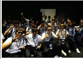
B組 パナソニックセンター