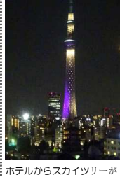
ホテルからスカイツリーが

3日目は、全員でスカイツリーへ行った後、A組は水上バスで隅田川を下りお台場で分散研修。B C組は浅草と上野公園で分散研修をしました。