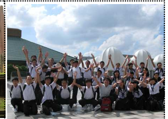
C組 江戸東京博物館