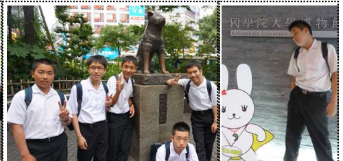
国学院大学博物館