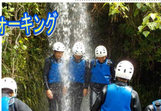
滝に打たれて修行