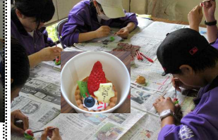
C組 食品サンプル作り