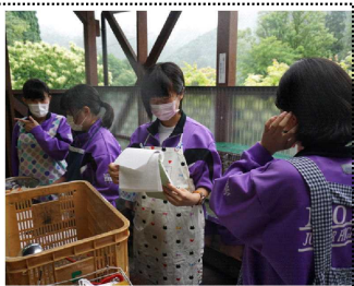
「どうやって作るんだっけ」