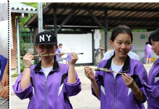
自分でつかみ開いたアユの味は...