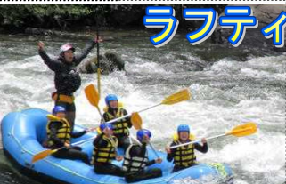
急流を乗り切りガッポーズ!