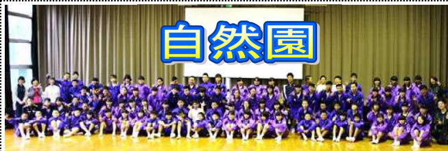
雨のため自然園の体育室で撮りました