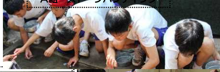
A組 ストーンハンティング