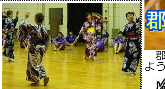
「かわさき」のお手本