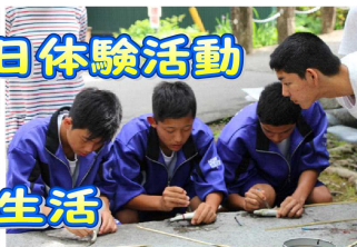
作った包丁でアユを開きます