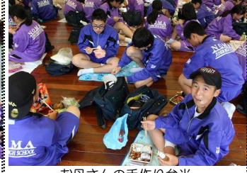
お母さんの手作り弁当