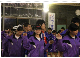
フォークダンスもうまく踊れました