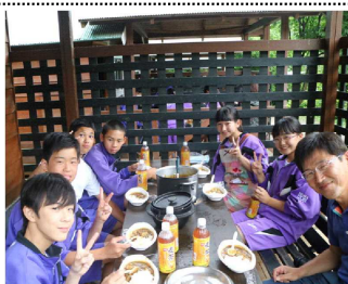
おいしくカレーができました