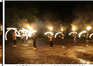
すばらしいトーチトワリング