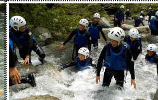
水が冷たくて気持ちいい!