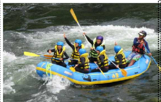
急流はスリルがあって、最高!