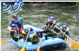
力を合わせて「せーの!」