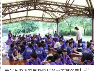
テントの下で身を寄せ合って食べました