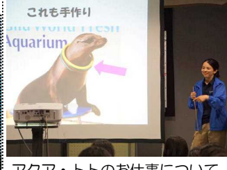
アクア・トトのお仕事について