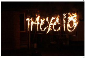
Tricycleが闇に浮かび上がりました