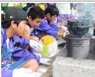
すぐれものかまどセット