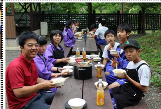
郡上鍋をおいしくいただきました