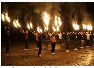
そしていよいよクライマックス