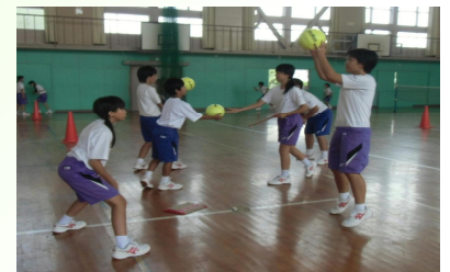
ステーションサーキット

短い時間で集中して楽しく技術を習得できるよう、場の設定や教具の工夫をしたステーションサーキットを毎時の授業の初めに取り入れました。また初期段階では、ゲームを楽しむために必要な技能を身に付けるためにゴロバレーボールを取り入れ、ボールをしっかり打つ技能や、相手のコートに空いている場所を狙う感覚をつかませながら、ラリーを続ける楽しさや喜びを味わわせるステップとしました。次に、「ラリーを続ける」ことに重点をおきワンバウンドバレーボールを取り入れ、チームで攻防の仕方を工夫させることで、作戦に適した集団的スキルを活用できるように計画しました。