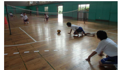
ゴロバレーボール

自分たちのゲームを振り返らせることにより、よかった点や課題を明らかにし、その課題解決に向けての練習方法や作戦を工夫させました。チーム内で根拠を明確にし、話し合ったことを筋道を立てて発表することで、学級全員がバレーに対する学習課題への取り組み方を工夫できるようにしていきました。また、人数も1チーム3人とし、3段攻撃で必ず一人1回触って返球するというルールがあったため、役割把握もしやすく取り組み、意見を交わし合えました。