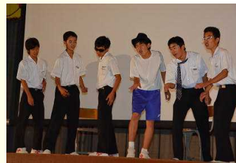
迫力の和太鼓演奏・津軽三味線・合唱・バンド演奏など鑑賞しました。