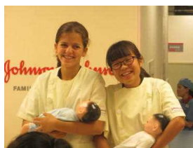
赤ちゃん？をだっこ