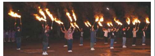
練習の成果を発揮した、トーチトワリング

どしゃぶりの雨と激しい風の中を出発した初日でしたが、アクアトの見学をし、自然園に無事に到着しました。夕食は班ごとにカレーを作りました。キャンプファイヤーは、キャンドルサービスとなりましたが、各クラスのスタンプを大に楽しみました。トーチトワリングも行い、一生懸命練習してきた成果を発揮し、見事な演技を披露することができました。火文字のTricycleも心に残りました。2日目の一日体験プログラムは前日の雨による影響が心配されましたが、無事に予定通り行われました。各体験とも、自然の中で楽しみながら活動することができました。夜は、無形文化財に指定されている「郡上踊り」を踊りました。3日目はクラスごとに半日体験プログラム研修を行いました。A組はストーンハンター工房で、B組は水うちわ工房で、C組は食品サンプル工房でそれぞれ体験をしました。リーダーシップとフォロワーシップが大に発揮され、大きく成長できた3日間の研修になりました。