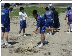
清掃する生徒の様子