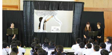
海の子文庫さんの講演の様子

「海の子文庫」の皆さんにブックパフォーマンスをしていただきました。今回は、『木』をテーマに行われ、様々な絵本や物語の楽しさに触れることができました。