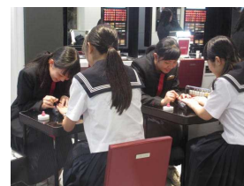
きれいに塗ってね