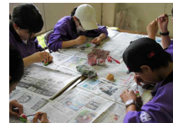
食品サンプル作りの様子