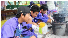
カレーを作る生徒の様子

1日目：岐阜アクアト、キャンプファイヤー 2日目：一日体験プログラム；郡上踊り 3日目：半日プログラム