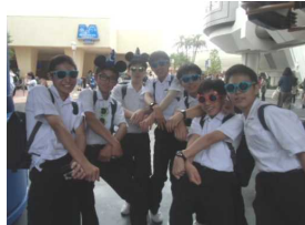
ディズニー、楽しんでます