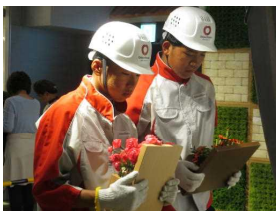
ダイワハウスの仕事に真剣