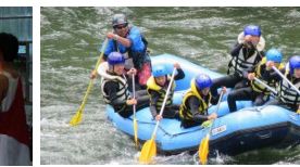
心一つに、ラフティング！