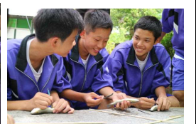
作ったナイフで鮎を調理