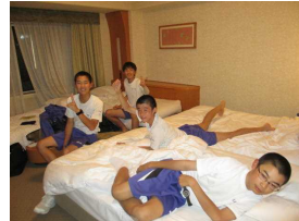
ホテルの部屋でまったり