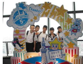
スカイツリー、景色は最高