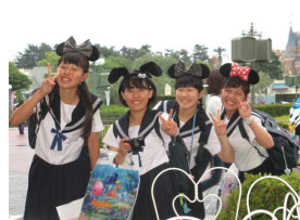
おそろいの耳でポーズ！