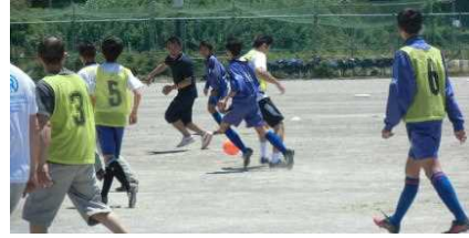
保護者の皆さんとゲームを楽しむ生徒

各地域のごみゼロ運動のあと、多くの保護者の皆様に、授業参観にお越しいただきました。ふれあいタイムでは、どの部においても、保護者の皆様と生徒が笑顔で活動し、大変貴重なふれあいの場となりました。