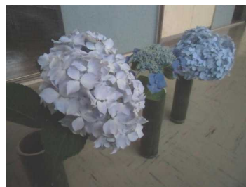
校長先生から紫陽花のプレゼント

6/19(月)の朝会で、校長先生が各クラスにあじさいの花を配ってくれました。竹の花瓶に活けられ、とても趣があり、教室を彩ってくれています。朝会で舞台に並べられたあじさいの花の色は様々でした。みなさんは、あじさいの花の色がどうして違うのか知っていますか？あじさいの花の色は、育った土によって決まります。あじさいは、アントシアニンという色素がはたらいて青色系や赤色系の色になります。青色系は、土の中のアルミニウムが吸収され、色素と結合して発色します。逆に、アルミニウムが吸収されないと、赤色系が発色します。アルミニウムは酸性の土でよく溶け、アルカリ性の土では溶けません。だから、酸性の土では青い花になり、アルカリ性の土では赤い花になります。