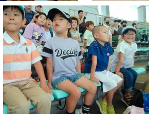
1年 名古屋港水族館