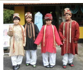
5年 リトルワールド