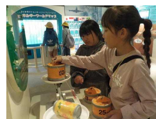
3年 ガスエネルギー館

野間小HPでは、野間小だよりでは紹介できなかった行事や授業の様子もご覧いただけます。 野間小HPは、こちらから→