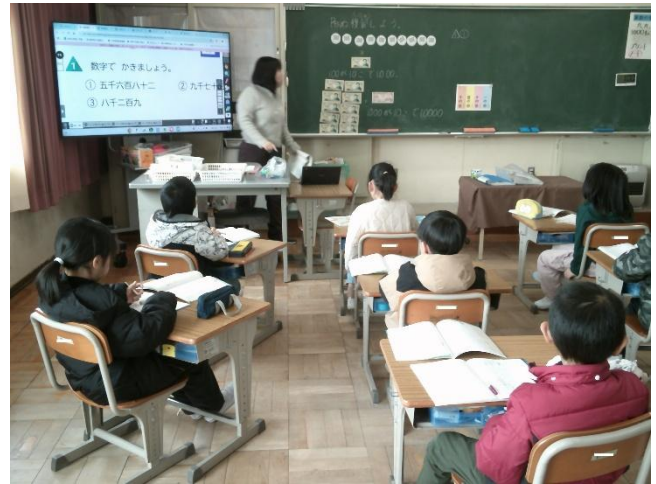
2年生 算数の授業の様子

とつぶやきました。後ろで見ていた私には、このなぞなぞのようなつぶやきが一瞬何のことか分かりませんでした。黒板に目をやると納得しました。どうやら、千円札と一万円札に描かれる2人の偉人の肖像画を見て疑問をもったようでした。（※教具は旧紙幣の物を使っています）