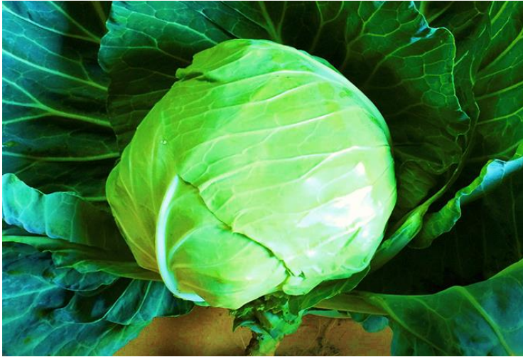
大きな葉にくるまれたキャベツ