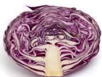
むらさきキャベツ