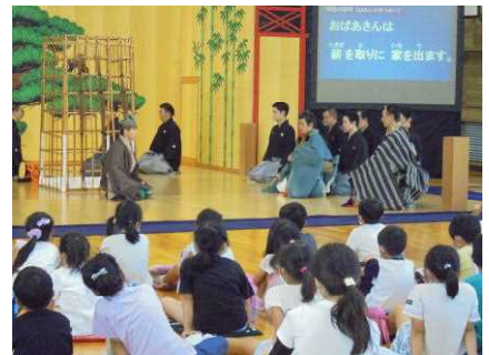
【狂言「柿山伏（かきやまぶし）」】