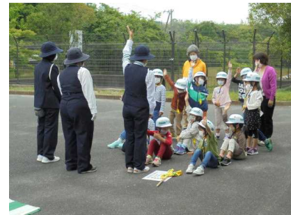
【1年生 歩行訓練 合い言葉は、は・ひ・ふ・へ・ほ】