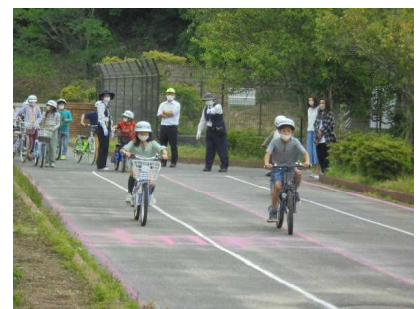
【3年生 自転車訓練 交通ルールを守って安全に乗ろう】