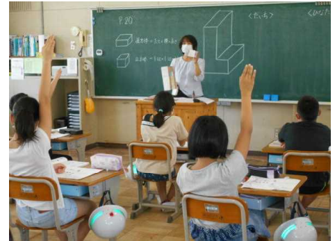
いつもの授業風景（5年算数）

「新しい生活様式」については、手洗いの徹底を何より優先して指導しています。給食は感染リスクが最も高いため、みんなで楽しく会食というわけにはいかず、全員が前を向いて静かに食べている状態です。しばらくの間は仕方がないかと思えます。今後は、梅雨と暑さへの対策も考えながらの生活となります。ご家庭でも体調面にお気をつけください。