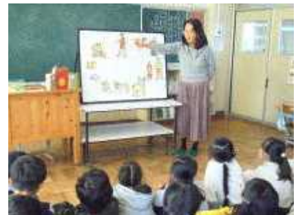
3・4年ブックトーク