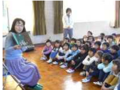
1・2年ブックトーク