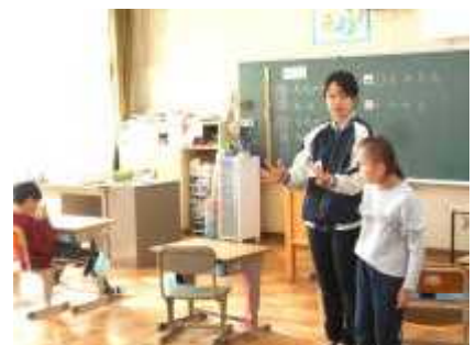
さつき・つつじの授業風景