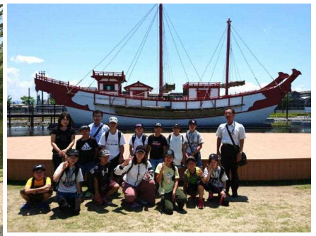
平城宮跡(遣唐使船)