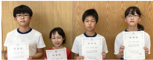
【後期児童会役員のみなさん】

10月12日(月)の朝会で、後期の児童会役員、委員会、学級代表の任命式を行いました。校長先生から任命状を受け取る時の表情から、一人一人のやる気を感じられました。みなさんの活躍を期待しています。