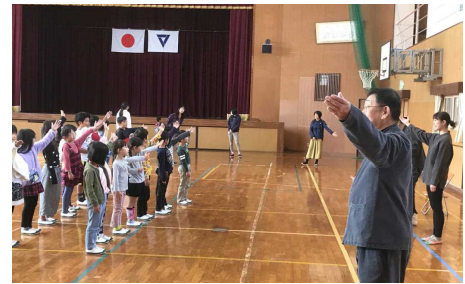
【ワークショップでの練習】

今年の芸術鑑賞会は、劇団「ともしび」に、オペレッタ「虎の恩返し」を上演していただきました。劇の最初には、1年生から4年生の児童が劇団の人たちと一緒に歌い、盛り上げました。低学年には少し難しい内容だったかもしれませんが、どの子も劇団の方々の歌と演技に引き込まれ、あっという間の80分でした。児童の感想には、「感動した」という言葉がたくさんあり、心に残る素晴らしい劇でした。