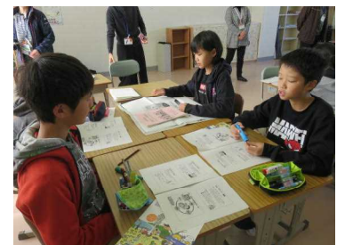
【6年認知サポーター学習】