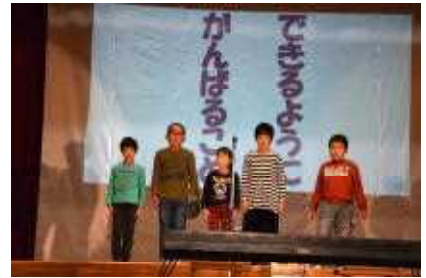
つつじ・さつき 朗読劇