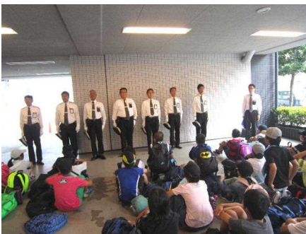
京都タクシー分散研修出発式

6月19日(火)・20日(水)の二日間、6年生が京都・奈良へ修学旅行に行ってきました。前日に大阪北部で発生した地震の影響が心配されましたが、特に混乱もなく行ってくることができました。二日目の奈良の分散研修は、雨のため全員での見学に変更しましたが、見学先でしっかりメモするなど意欲的に学習できました。二日間とも、病気やけがもなく、全員で楽しい修学旅行にできたことが何より素晴らしかったです。