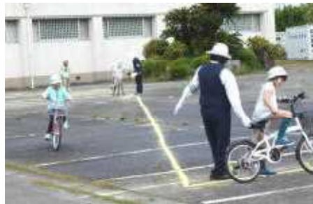
4年生 自転車訓練の様子

前日の雨が朝まで残り実施できるか心配しましたが、何とか予定通り交通教室を実施することができました。