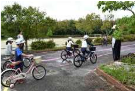
2年生 自転車訓練の様子