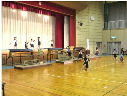
1年オペレッタ てぶくろをかいに