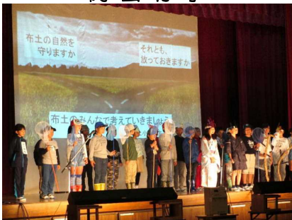
3年 布土川 どうなる？