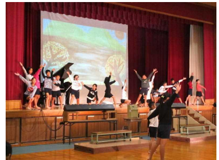
5年音楽舞踊劇 大造じいさんとがん