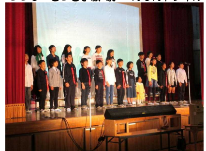
6年 劇 もういちど ハッピーバースデー