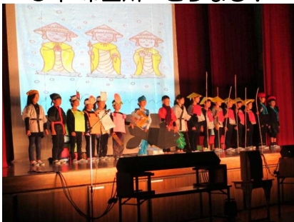
2年 劇 かさじそう