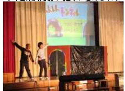
つじ・さつき学級 劇 へんしんトンネル