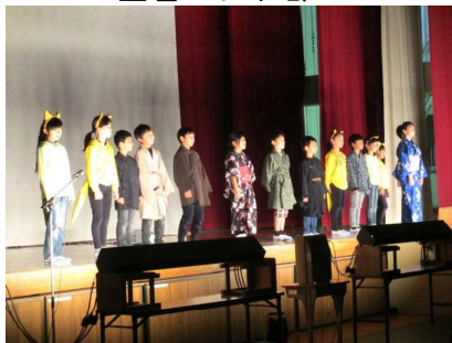
4年 劇 ごんぎつね