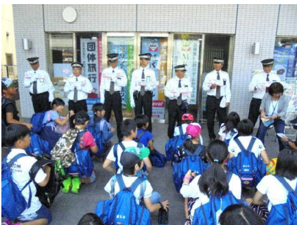
京都タクシー分散研修出発式

6月15日(木)・16日(金)の二日間、6年生が京都・奈良へ修学旅行に行ってきました。二日間も素晴らしい天気にも恵まれ、充実した活動をする事ができました。京都市内のタクシー班別研修・奈良市内の班別研修を、事前学習を生かし、班員で力を合わせて行うことができました。どちらの研修もトラブルに巻き込まれることなく、無事にゴールに到着できました。また、修学旅行の間中、病气やけがもなく、全員で楽しい修学旅行にできたことが何より素晴らしかったです。