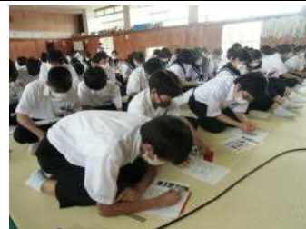
お弁当に何を选んでいるかな？