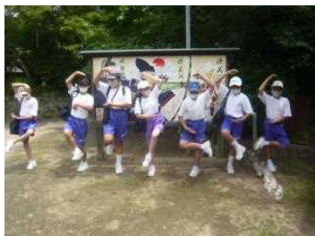
ウォークラリー（野間大坊）