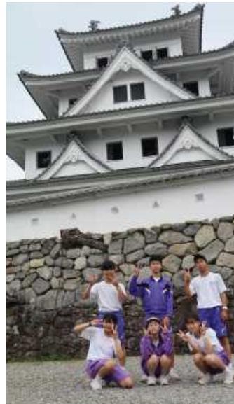
3日目 郡上市内散策