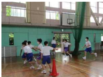
ミニ体育祭（リレー）

3つの小学校から入学した1年生は、新しい仲間と協力したり活動したりすることで集団の一員としての自覚を高めるために交流会をしました。体育館で開会式をしたあとミニ体育祭をしました。種目はドッジボールとリレーです。その後、ウォークラリー（学校から野間大坊・野間海岸周辺でチェックポイントをまわりミッションを遂行）をしました。午後は、若松海岸で海岸清掃をしました。