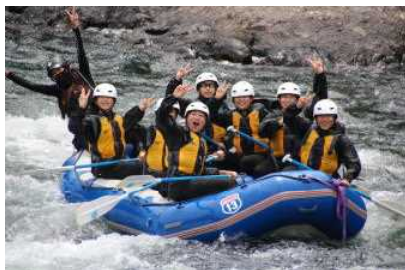
2日目 リバーラフティング