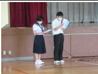
保健体育委員の発表

1期テスト3日目の午後、体育館で「めざせ！メディアコントロールの達人」をテーマに行いました。保健体育委員が、野間中生のメディア機器利用の実態、ネット犯罪やネット依存について発表し、メディアコントロールの大切さを訴えかけました。