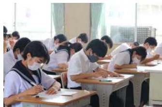
1年生（初めての定期テスト）

今年から定期テストを年4回にした最初の1期テストです。1年生にとっては中学校に入って初めての定期テストで勉強の仕方も学びました。3年生にとっては受験に関わるテストとなります。