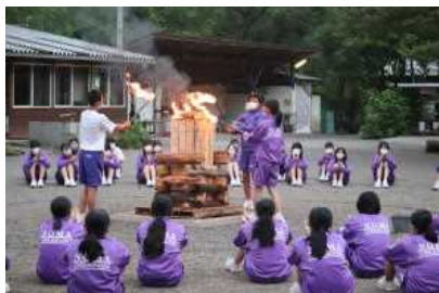
1日目 キャンプファイヤー

2年生は、2泊3日で郡上八幡研修に行きました。1日目は自然園に到着後に登山、夕食は焼きそばで、夜ファイヤーで盛り上がりました。2日目は、リバーラフティングと猟師体験に分かれ1日体験をしました。夕食にカレーを作り、その後家族からの手紙を読み家族へ手紙を書きました。3日目は、午前中郡上市内散策し帰路につきました。3日間しっかりと楽しんで体験をしてきました。